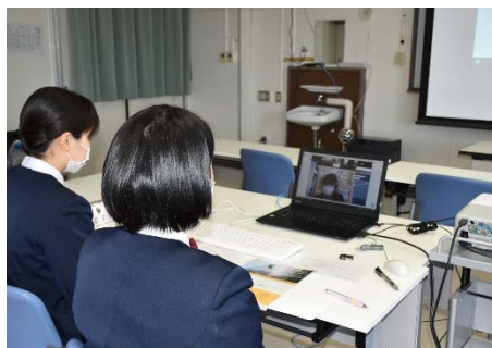
青森県庁職員（2名参加）