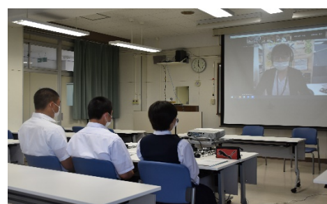
青森消防職員（3名参加）