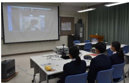
青森銀行職員（3名参加）