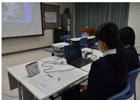
青森市役所（2名参加）